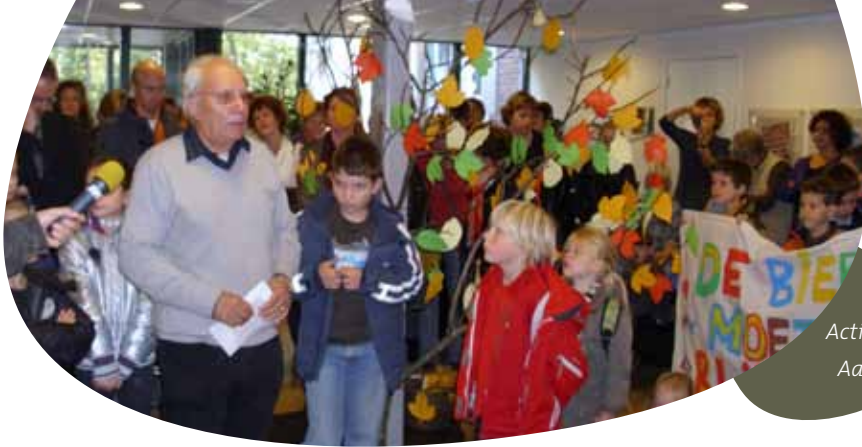
Actie in Aalst